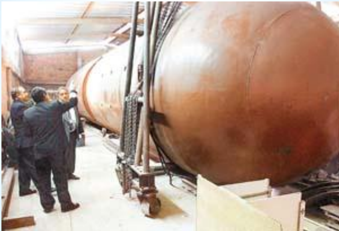
Semisumergible hechizo capturado en Colombia