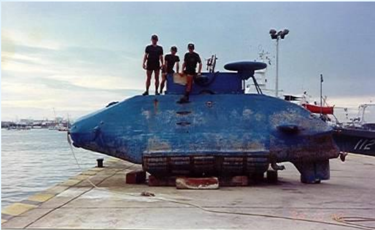
Semisumergible hechizo capturado en Colombia